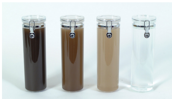
Vattenprover från system behandlat med EnwaMatic® teknologi. Dag 1 till dag 30 från vänster till höger.