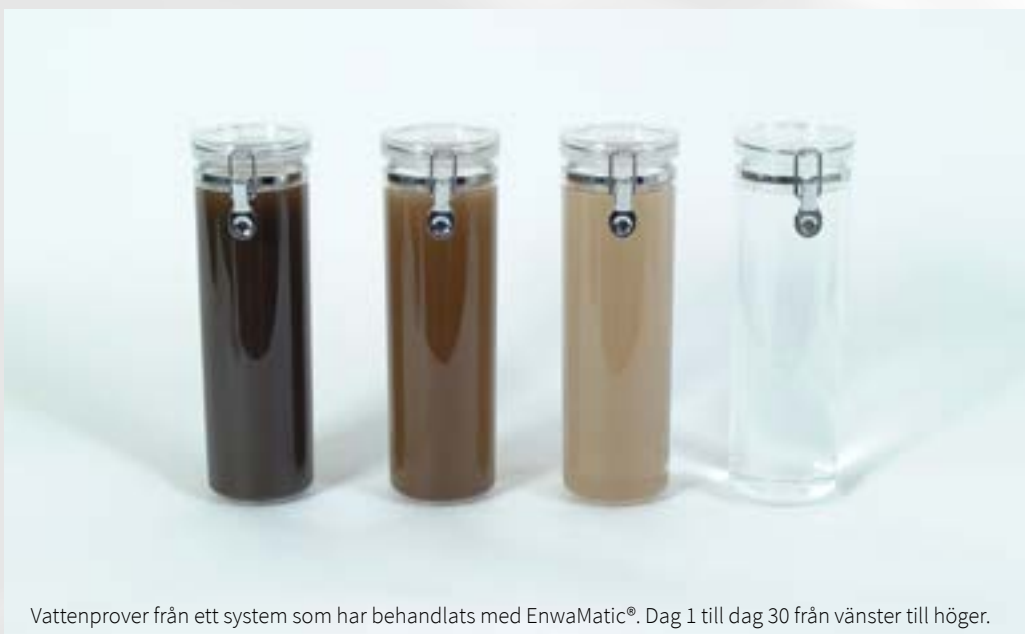
Vattenprover från ett system som har behandlats med EnwaMatic®. Dag 1 till dag 30 från vänster till höger.

EnwaMatic® är ett miljövänligt alternativ till kemisk dosering. Genom en kontinuerlig självreglerande vattenbehandling som ger en optimal energiöverföring. Detta förlänger anläggningens livslängd och reducerar service och underhållskostnader.