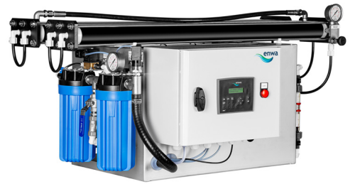
Rektangulär rack liten