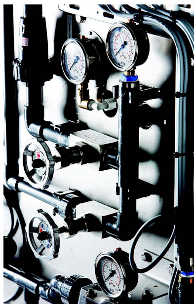
Flödes och tryckregleringssystem

Enwas rack finns i olika utföranden. Bland annat typ Z, typ rektangulär, typ L eller i kundanpassat rack.