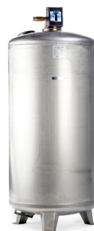
Remineraliseringsfilter N-175 RO Rostfritt stål, AISI 316L Manuell backspolning