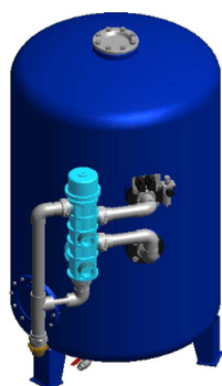
Sandfilter SA-1000 Filtertank gjord av kolstål med in- och utsida av ett icke-poreus polyetenfoder Automatisk backspolning